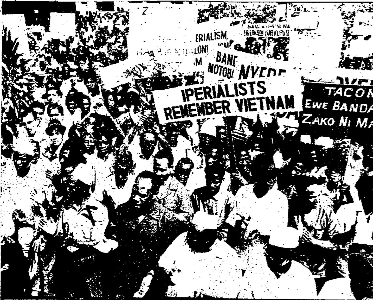
جذب من جمهور يبلغ تعدادها ثمانية آلاف جاب شوارع دار السلام امس وهم يحملون لافتات وينادون بشعارات تندد بالكتاتور بقدا رئيس ملاي بسبب مطلقته لجزء من تقاضياتها الهائلة «صورة من المظاهرات»